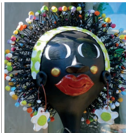
COVER Bahia Girl, Praya do Forte, Brasil