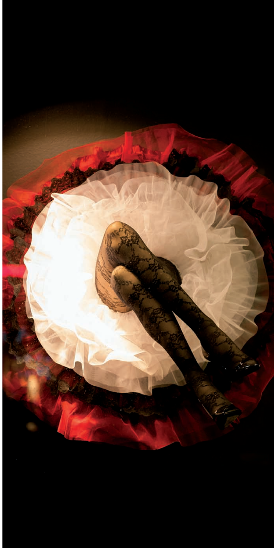
LEFT STORE El Corte Inglés, Madrid, Spain

Als Art Director seiner eigenen Werbeagentur La Casa de los Fideos bringt er seine sehr persönliche Sicht von Werbung und Marketing ein und benützt diese als Bindeglied zwischen Visual Merchandising und globalen Brands.