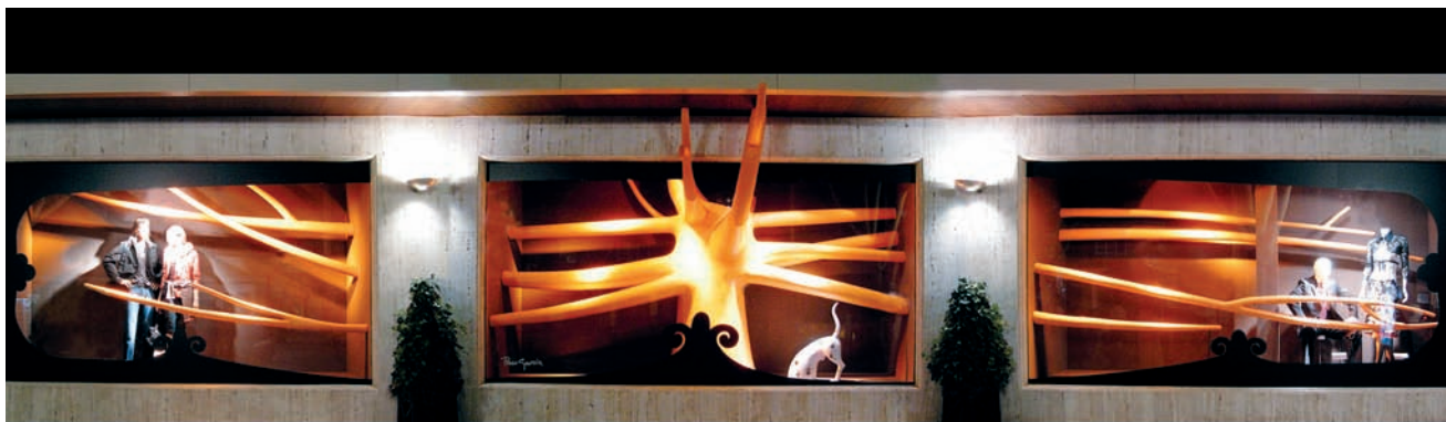
TOP STORE El Corte Inglés, Madrid, Spain