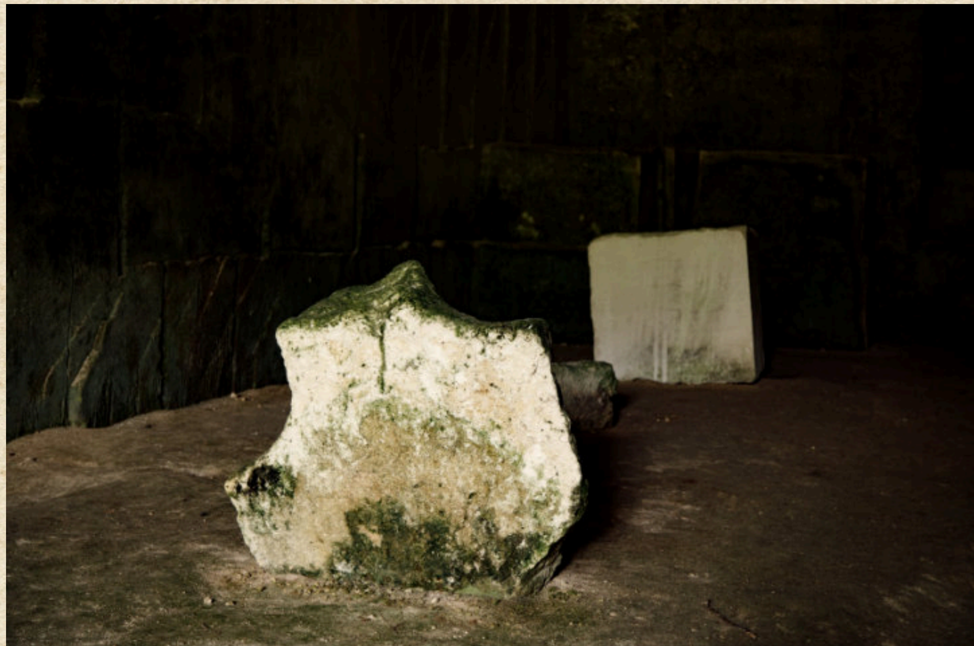
Les 2 premières pierres du monde