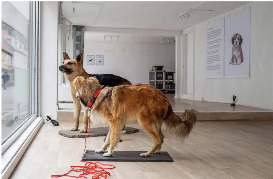
De to udstoppede hunde i Galleri Teses vinduesparti indgår i udstillingen "Bacon af hvalp" og får markante reaktioner fra både besøgende i udstillingen og fra forbipasserende.

»Med "Bacon af hvalp" undergår jeg ikke at blive politisk, og jeg kommer nemt til at fremstå hellig, men det er ikke min mission, at udstillingen skal være en løftet pegefinger. Jeg vil gerne formidle fakta og trykprøve vores måde at betragte dyr på. Som mennesker har vi kapaciteten til at behandle alle dyr ordentligt. Og det forpligter.«